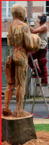
Vincent Givogre, sculpteur