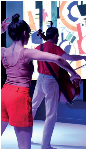
Spectacle «Dancelles»-compagnie Nawel Oulad

Œuvres monumentales en bois de Vincent Givogre et sculptures de Ramona Bächtiger, artisans d'art à Pernes.