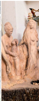
Ramona Bächtiger, sculptrice